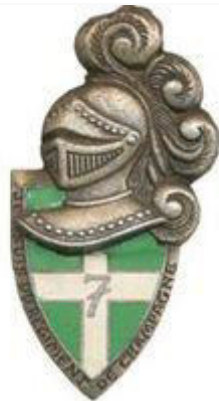
Insigne régimentaire du 7 e régiment d'infanterie