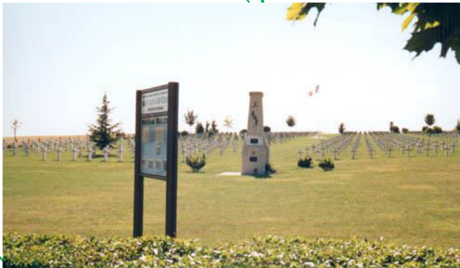
Attribution-NonCommercial-NoDerivs 3.0 Unported.

Créée en 1922, située au Nord est de Châlons en Champagne, sur la RD 66 entre Somme-Tourbe et Minaucourt. Elle rassemble les corps de 2222 soldats français de la première Guerre Mondiale, issus des cimetières de guerre de St Jean Sur Tourbe-Gizaucourt-La Croix en Champagne-Laval sur Tourbe-Somme-Tourbe et Somme-Bionne.