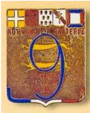
Insigne régimentaire du 9 e Régiment d'Infanterie.