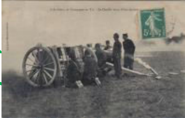
L'Artillerie de Campagne au Tir - La Douille vient d'être éjectée