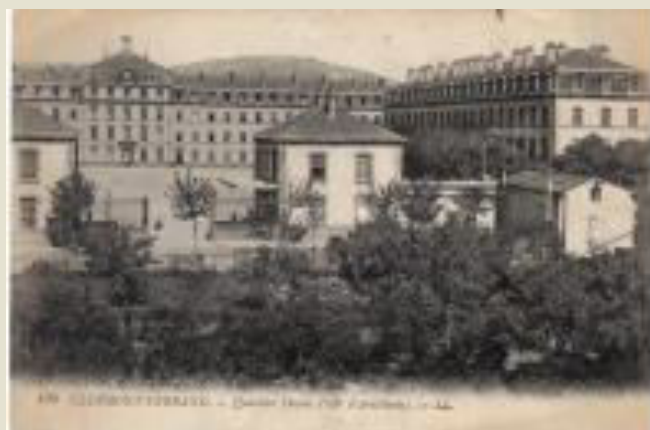
Clermont-Ferrand - Quartier Desaix (53 e d'Artillerie)