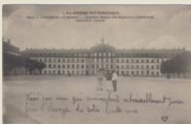
Clermont-Ferrand - Quartier Desaix (53 e Régiment d'Artillerie) - Bâtiment Central