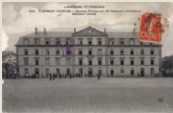
Clermont-Ferrand - Quartier Gribeauval, 53 e Régiment d'Artillerie - Bâtiment Central