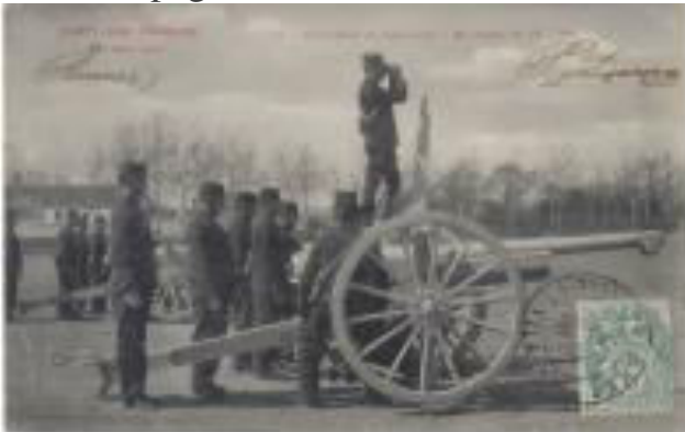
Artillerie de Campagne - Matériel de 75mm – Feu