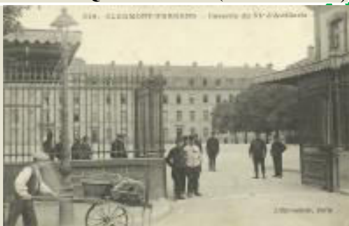
Clermont-Ferrand - Caserne du 53 e d'Artillerie