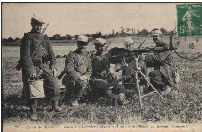
196 — Camp de MAILLY. Soldats d'infanterie actionnant une mitrailleuse en terrain découvert.

Le Général Degoutte, lui, pousse vigoureusement de l'avant; et c'est maintenant de ce côté, la lutte pour Château-Thierry, déjà débordé par le Nord, cependant que de Mitry continue sa pression au sud, et que la 5 e Armée Française de Berthelot attaque la poche par l'est.