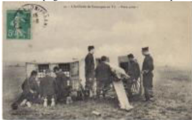
L'Artillerie de Campagne au Tir - Pièce Prête