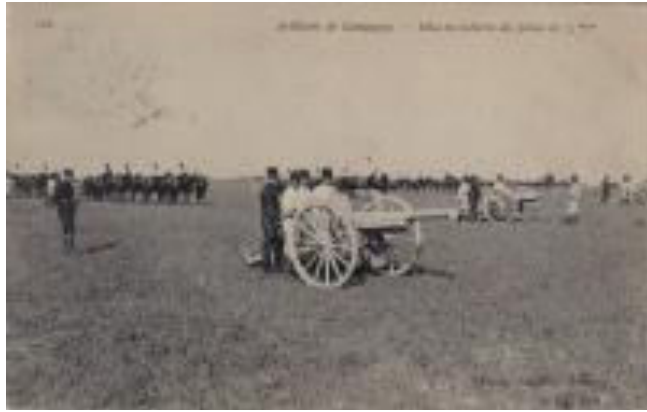
L'Artillerie de Campagne - Mise en batterie des pièces de 75mm