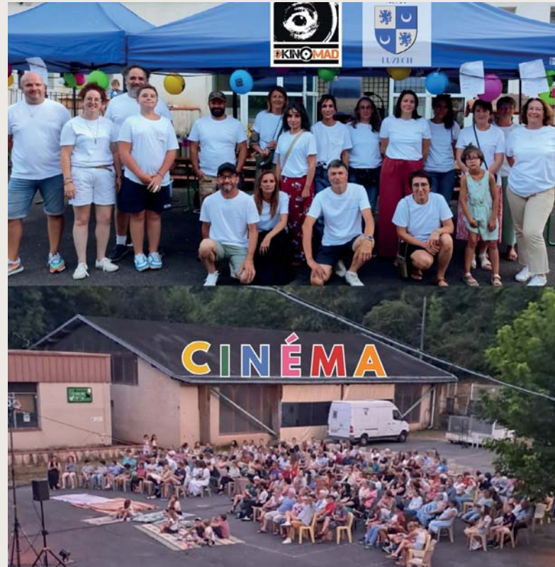
Ciné en plein air, soirée de partenariat entre l'ACAV et Kinomad.

Après une magnifique 1ère projection/débat de rentrée à St Vincent en partenariat avec Radio Tilleul, l'Adéar et la Maison des Semences Paysannes le 15 octobre dernier, c'est le Mois du Film Documentaire qui revient en novembre, et la KinoTeam a programmé plusieurs soirées autour de sa 12ème édition des Kinodocs 2025. Ça commence le samedi 15 novembre , avec le documentaire «Le vivant qui se défend» à la Salle du Barry de Luzech en partenariat avec le Gadel. Le lendemain, dimanche 16 novembre , Kinomad s'est associé à Radio Tilleul et au Comité des fêtes de Saint-Vincent Rive-d'Olt pour projeter un film documentaire dont le choix n'est pas encore arrêté (Programmation en cours). La semaine suivante, le samedi 22 novembre , soirée