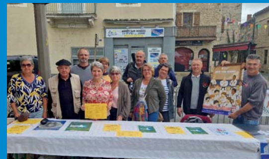
L'URCL bien présente au dernier Forum des associations

A ce jour, seules quatre activités sont encore proposées, d'autres ont disparu ou sont devenues autonomes (Chorale). Le judo est devenu « l'Entente Luzech-Pradines ».